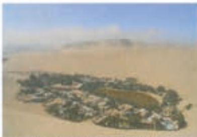
In der Wüstenase Huacachina in Peru hat sich das Ehepaar gefunden

„Schon immer zog es mich in die Ferne. Mit 17 bereiste ich für ein halbes Jahr Asien, ein Jahr später Südafrika und dann 2013 ging es für unbestimmte Zeit nach Südamerika. Peru sollte für mich nur eine Station auf dieser Reise sein. Doch dann traf ich mitten in der Wüste die Liebe meines Lebens ...“