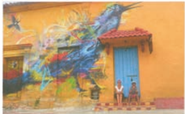
In Cartagena in Kolumbien